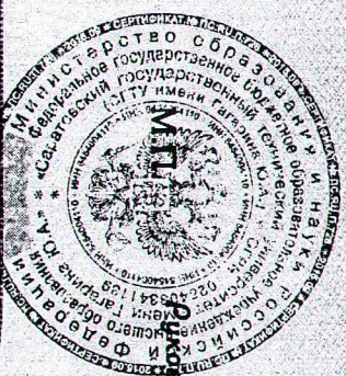
Рис. 001/01 Подпись